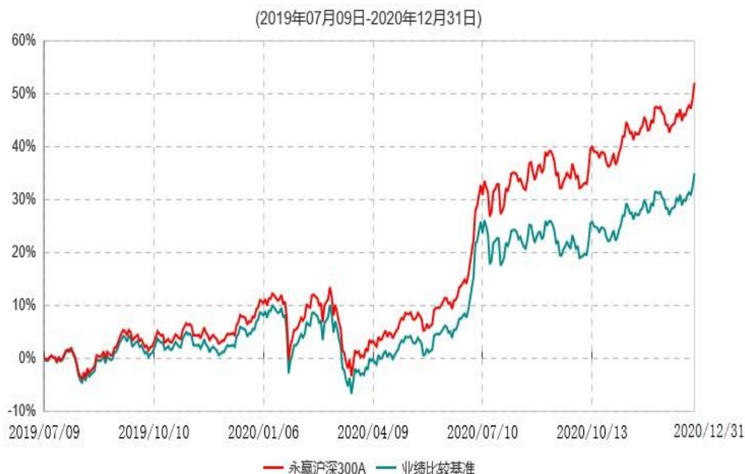
永赢沪深300A累计净值增长率与业绩比较基准收益率历史走势对比图