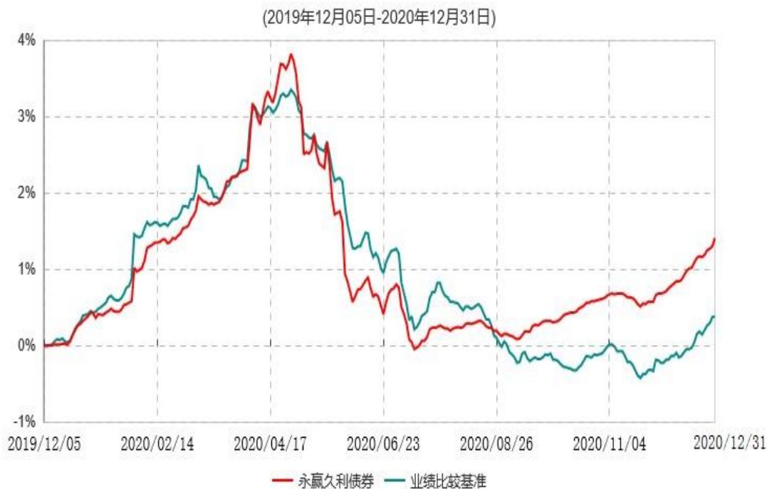
永赢久利债券型证券投资基金累计净值增长率与业绩比较基准收益率历史走势对比图