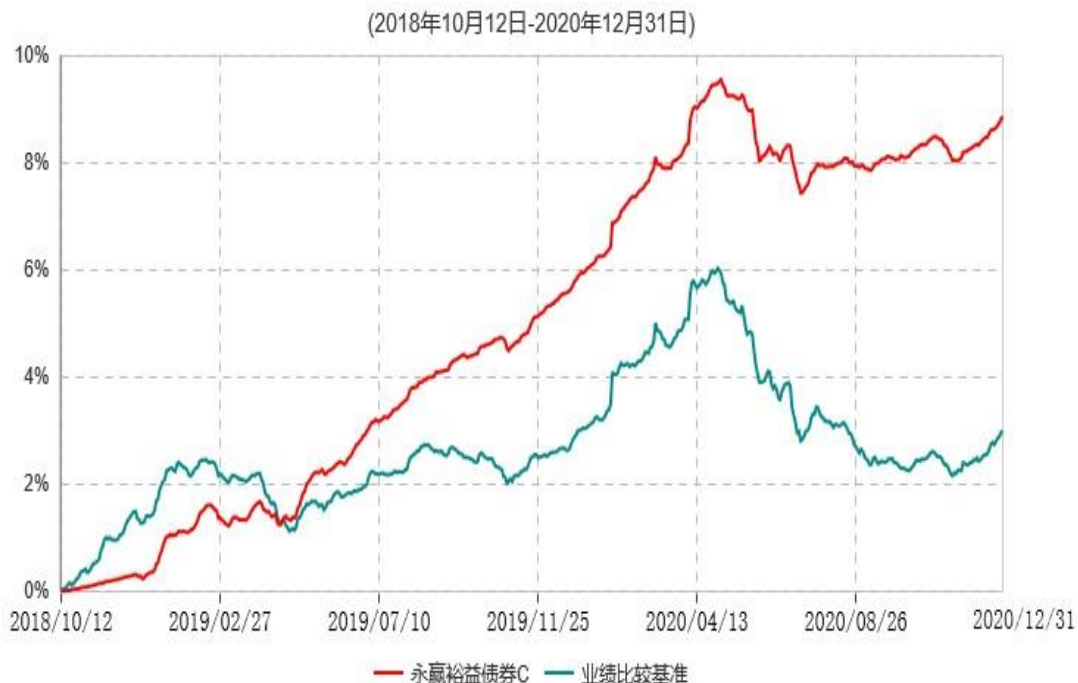
永赢裕益债券C累计净值增长率与业绩比较基准收益率历史走势对比图