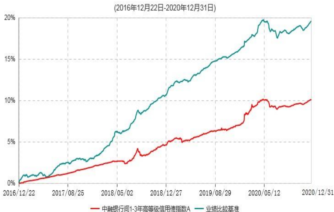
中融银行间1-3年高等级信用债指数A累计净值增长率与业绩比较基准收益率历史走势对比图