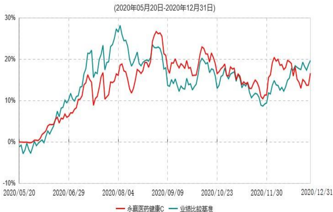
永赢医药健康C累计净值增长率与业绩比较基准收益率历史走势对比图