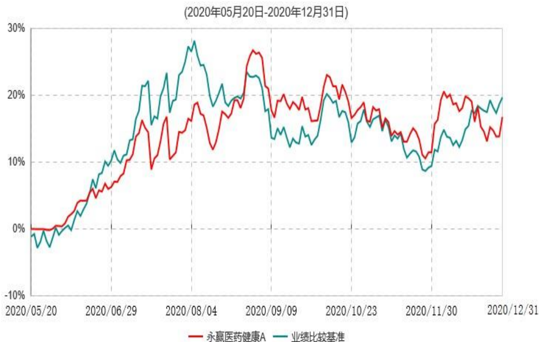
永赢医药健康A累计净值增长率与业绩比较基准收益率历史走势对比图

注：1、本基金合同生效日为 2020 年 05 月 20 日，截至本报告期末本基金合同生效未满 1 年；