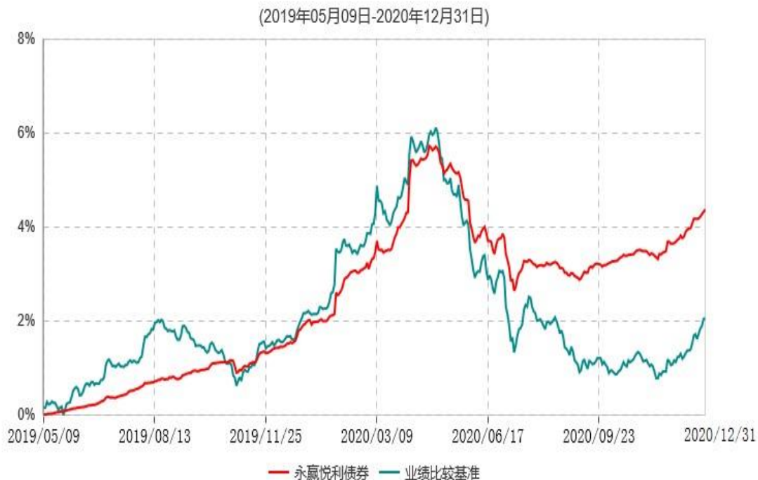
永赢悦利债券型证券投资基金累计净值增长率与业绩比较基准收益率历史走势对比图