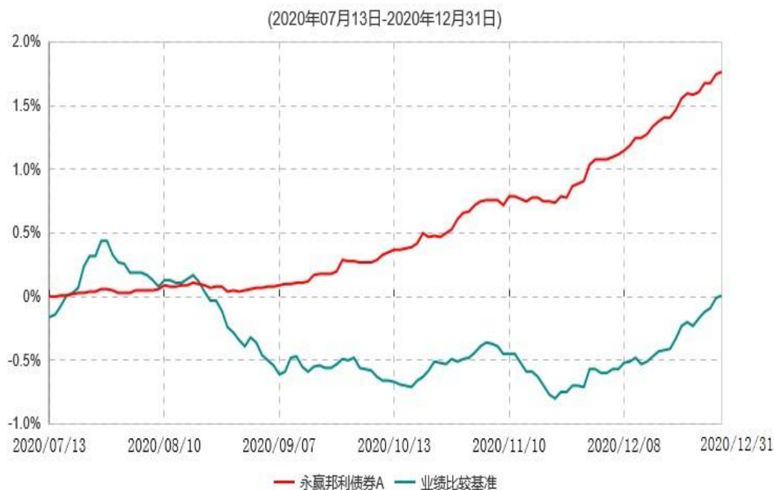
永赢邦利债券A累计净值增长率与业绩比较基准收益率历史走势对比图

注：1、本基金合同生效日为 2020 年 7 月 13 日，截至本报告期末本基金合同生效未满 1 年。