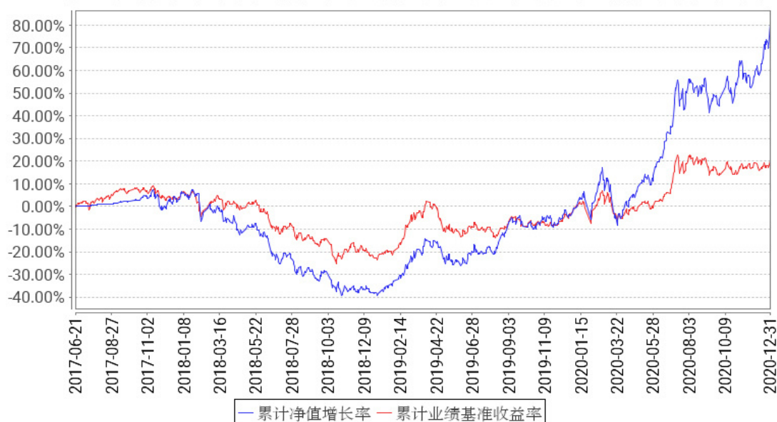
工银智能制造股票累计净值增长率与同期业绩比较基准收益率的历史走势对比图