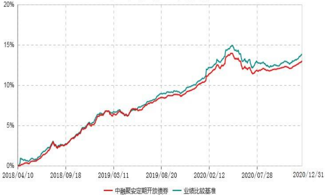
中融聚安3个月定期开放债券型发起式证券投资基金累计净值增长率与业绩比较基准收益率历史走势对比图 (2018年04月10日-2020年12月31日)

注：按基金合同和招募说明书的约定，本基金自基金合同生效日起6个月内为建仓期，建仓期结束时本基金的各项投资比例符合基金合同的有关约定。