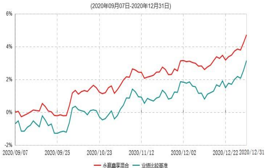
永赢鑫享混合型证券投资基金累计净值增长率与业绩比较基准收益率历史走势对比图

注：1、本基金合同生效日为2020年9月7日，截至本报告期末本基金合同生效未满1年； 2、本基金建仓期为本基金合同生效日起6个月，截至本报告期末，本基金尚处于建仓期中。