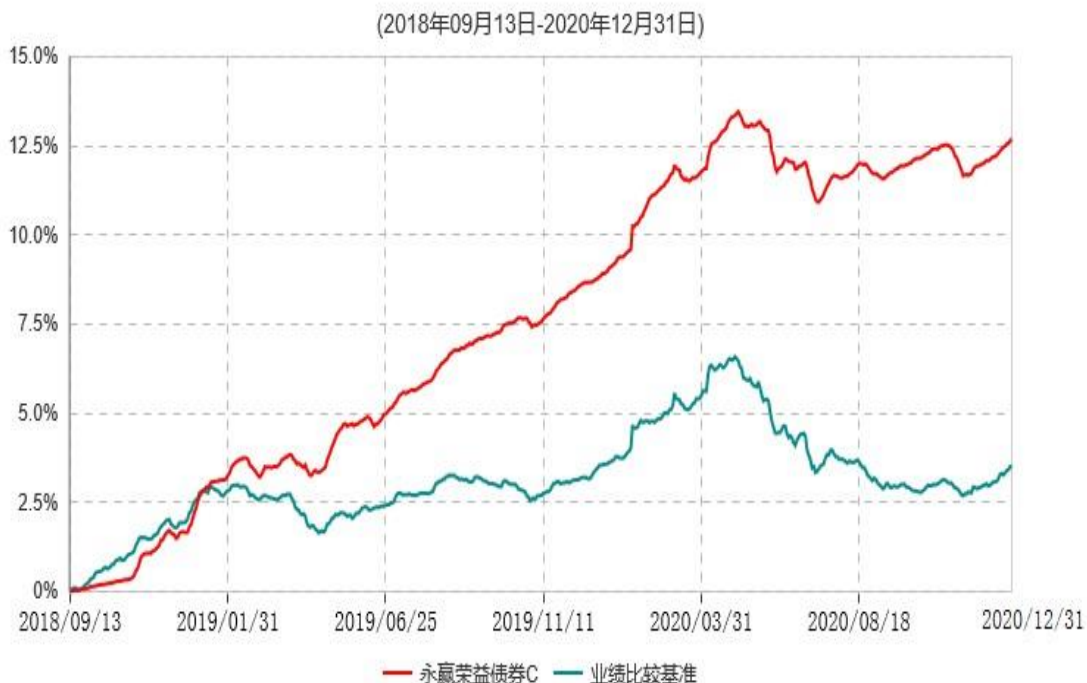
永赢荣益债券C累计净值增长率与业绩比较基准收益率历史走势对比图