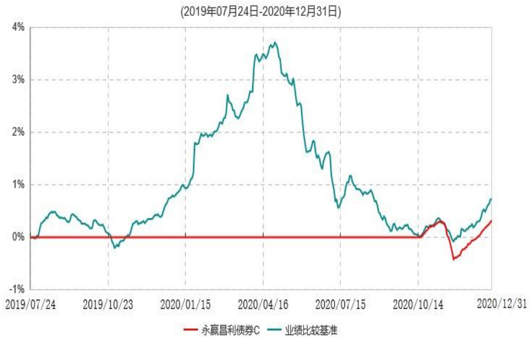
永赢昌利债券C累计净值增长率与业绩比较基准收益率历史走势对比图