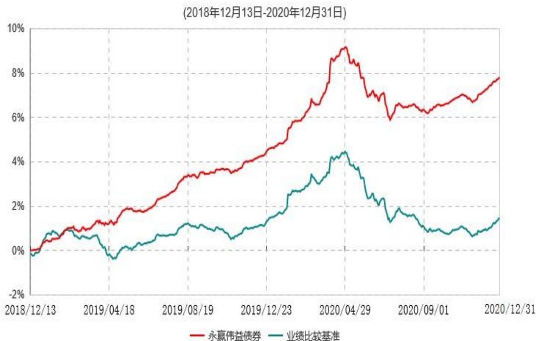
永赢伟益债券型证券投资基金累计净值增长率与业绩比较基准收益率历史走势对比图