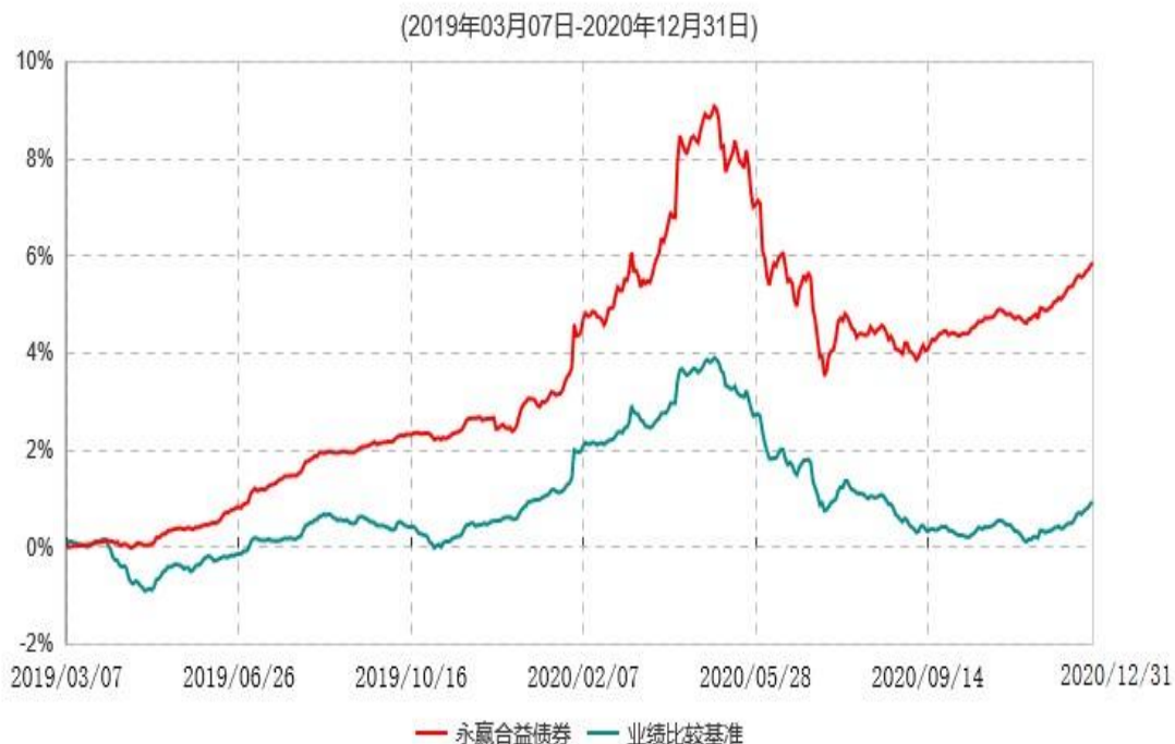
永赢合益债券型证券投资基金累计净值增长率与业绩比较基准收益率历史走势对比图