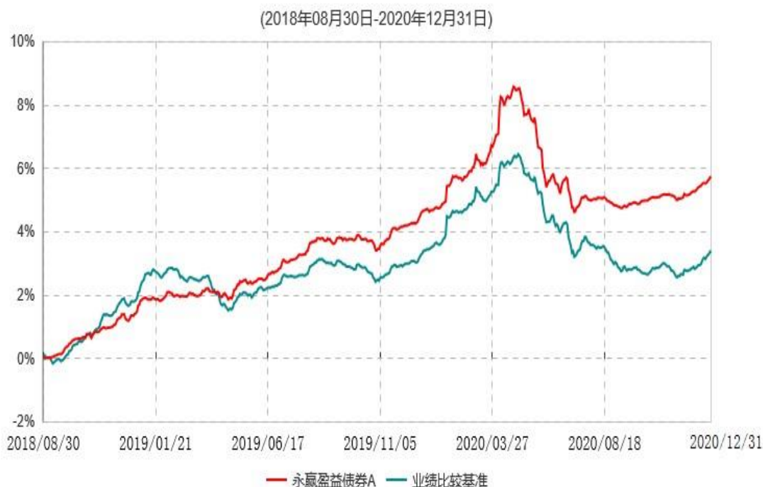
永赢盈益债券A累计净值增长率与业绩比较基准收益率历史走势对比图