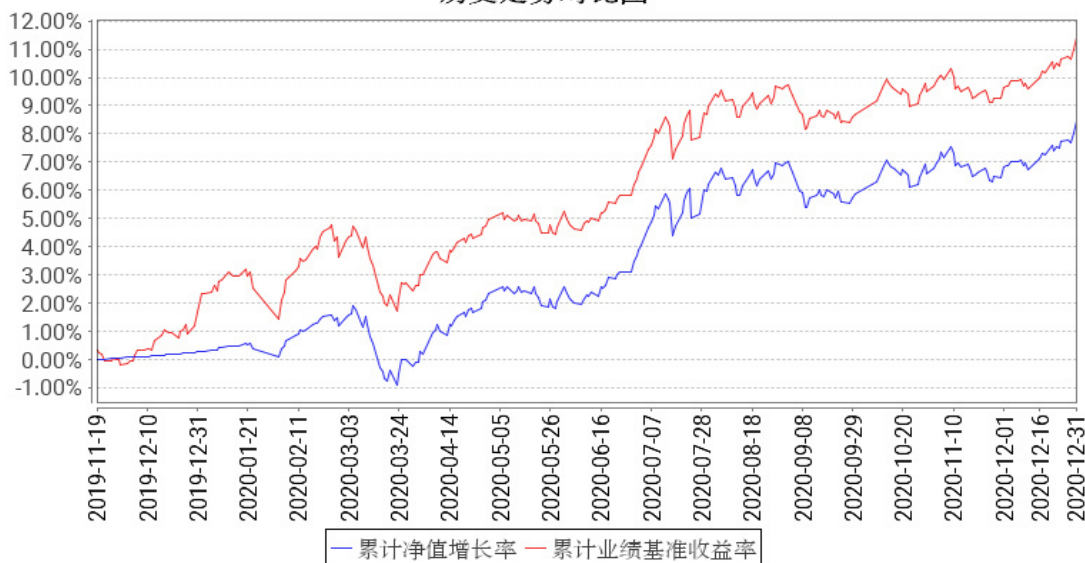
工银智远配置三个月持有期混合FOF累计净值增长率与同期业绩比较基准收益率的历史走势对比图