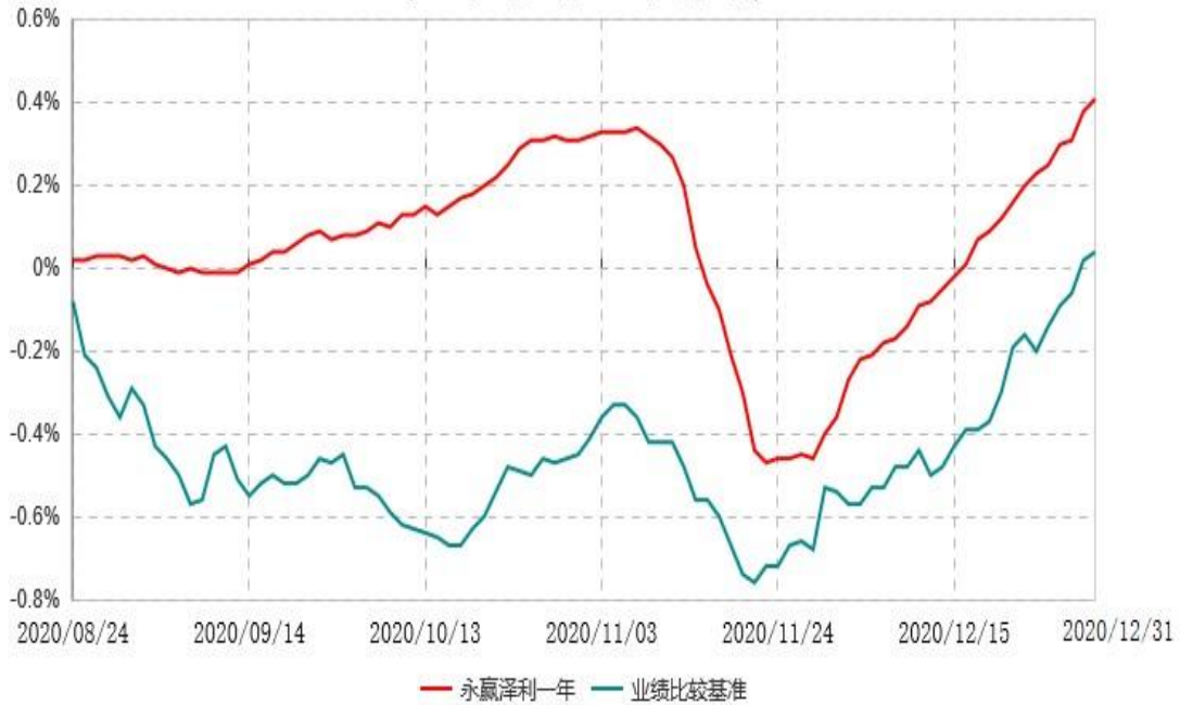
永赢泽利一年定期开放债券型证券投资基金累计净值增长率与业绩比较基准收益率历史走势对比图 (2020年08月24日-2020年12月31日)

注：1、本基金合同生效日为2020年08月24日，截至本报告期末本基金合同生效未满1年； 2、本基金建仓期为本基金合同生效日起6个月，截至本报告期末，本基金尚处于建仓期中。