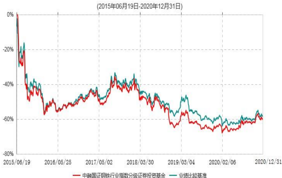
中融国证钢铁行业指数分级证券投资基金累计净值增长率与业绩比较基准收益率历史走势对比图

注：按基金合同和招募说明书的约定，本基金自基金合同生效日起6个月内为建仓期，建仓期结束时本基金的各项投资比例符合基金合同的有关约定。