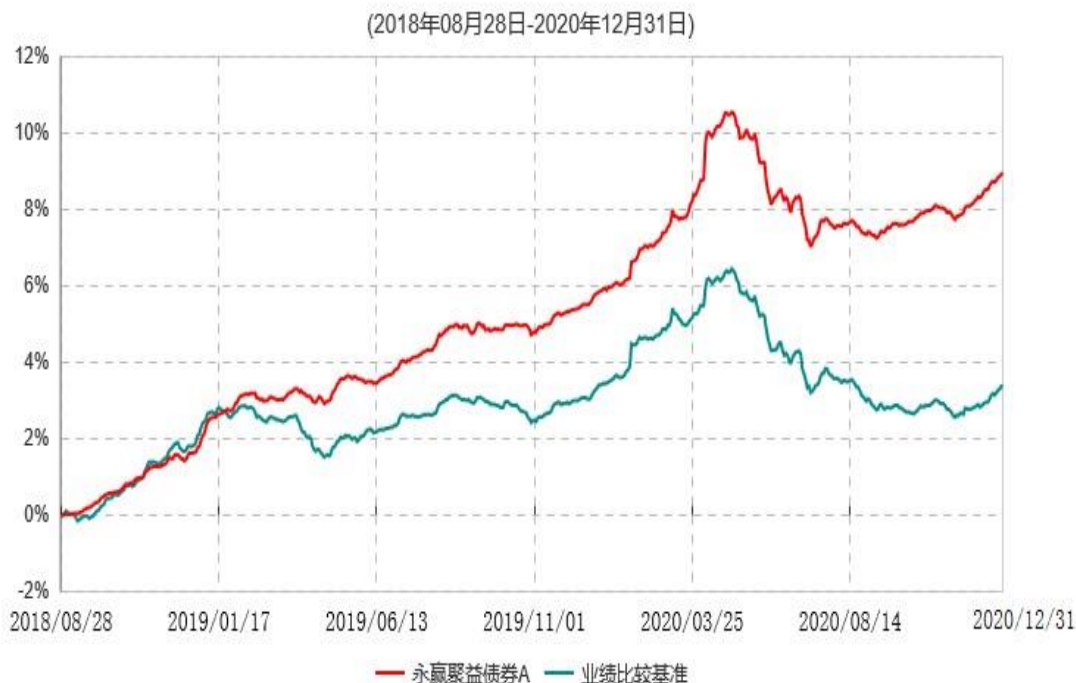
永赢聚益债券A累计净值增长率与业绩比较基准收益率历史走势对比图