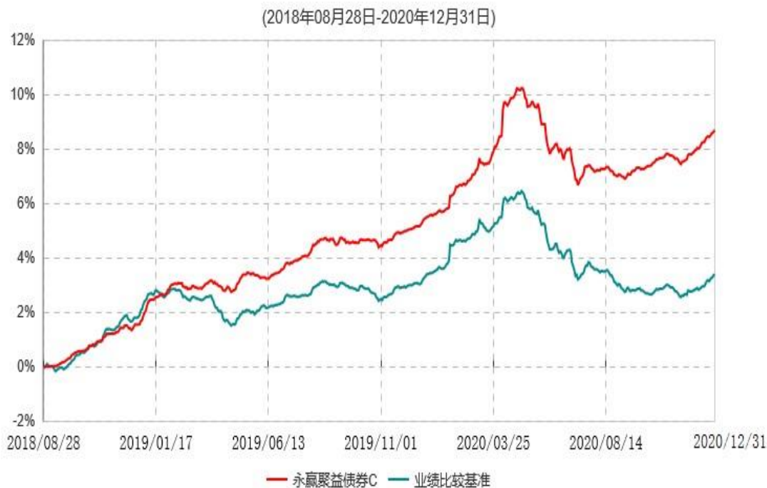
永赢聚益债券C累计净值增长率与业绩比较基准收益率历史走势对比图