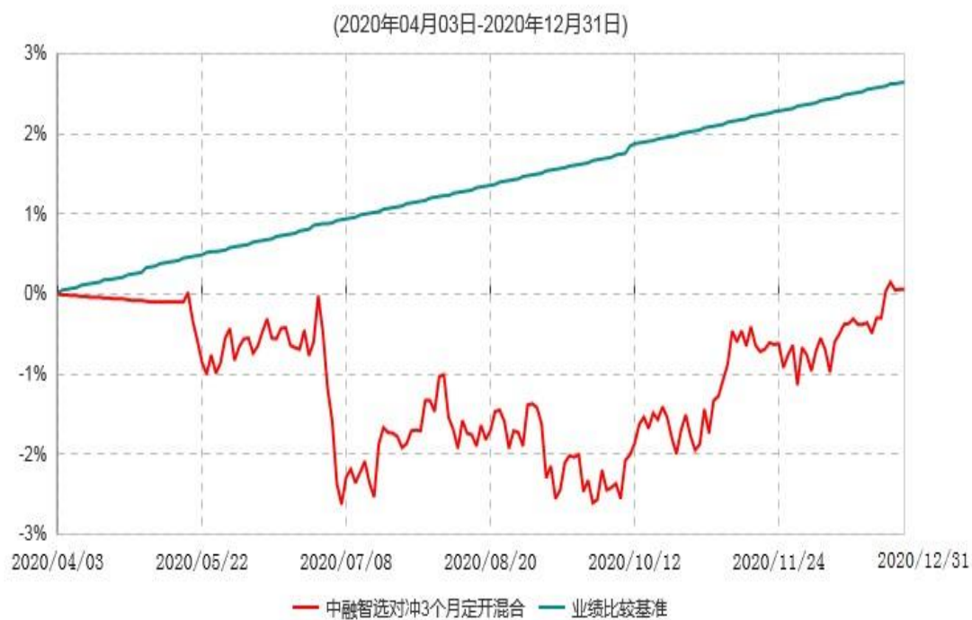
中融智选对冲策略3个月定期开放灵活配置混合型发起式证券投资基金累计净值增长率与业绩比较基准收益率历史走势对比图

注：按基金合同和招募说明书的约定，本基金自基金合同生效日起6个月内为建仓期，建仓期结束时本基金的各项投资比例符合基金合同的有关约定。