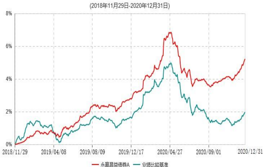
永赢昌益债券A累计净值增长率与业绩比较基准收益率历史走势对比图