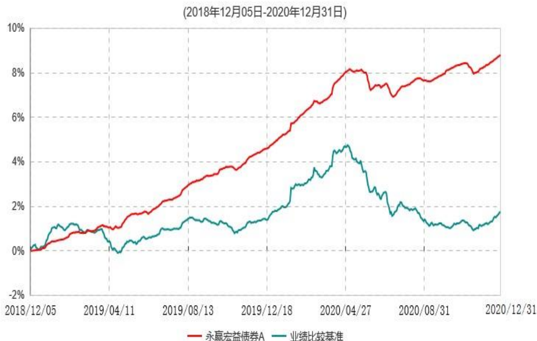
永赢宏益债券A累计净值增长率与业绩比较基准收益率历史走势对比图