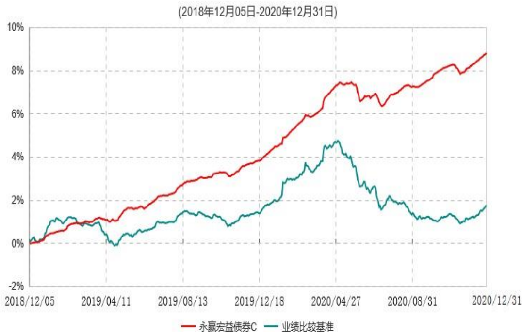
永赢宏益债券C累计净值增长率与业绩比较基准收益率历史走势对比图