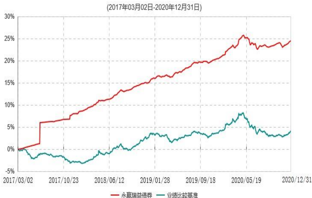
永赢瑞益债券型证券投资基金累计净值增长率与业绩比较基准收益率历史走势对比图