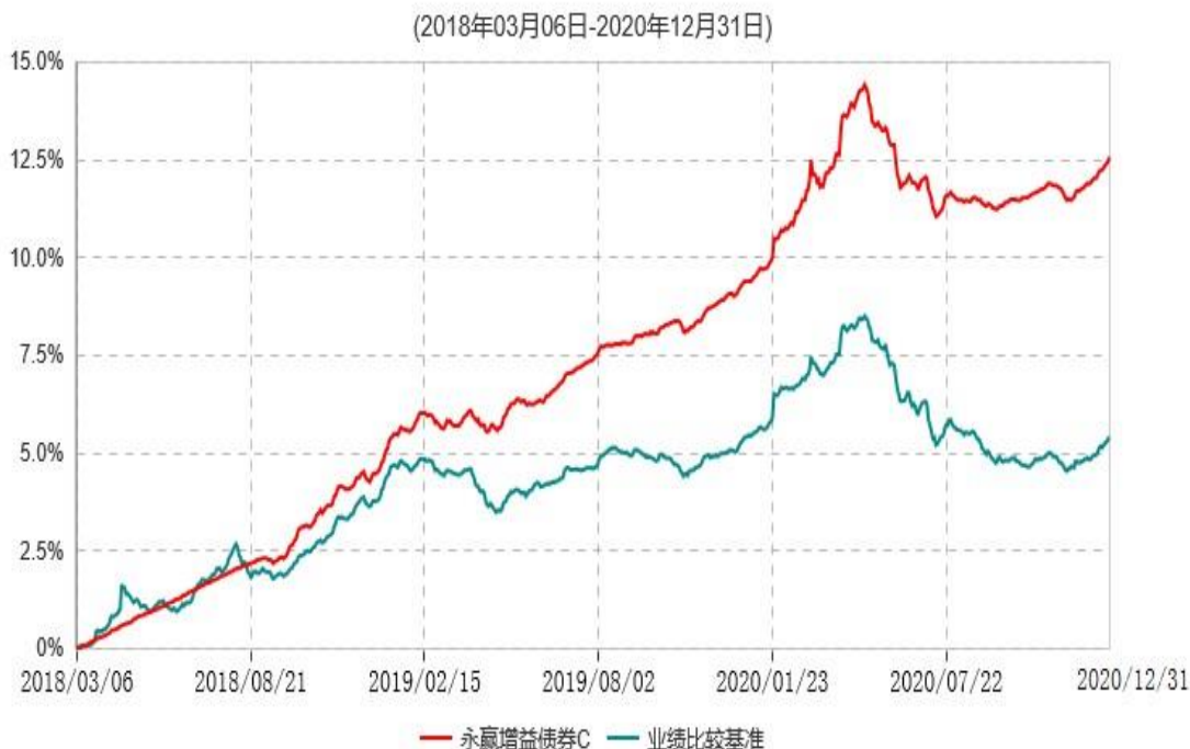
永赢增益债券C累计净值增长率与业绩比较基准收益率历史走势对比图

注：本基金建仓期为本基金合同生效日起 6 个月，建仓期结束当日，除债券投资比例未达到合同约定外，其他各项资产配置符合合同约定。债券投资比例未达到合同约定系交易对手原因导致现券买入交易结算失败所致，本基金于 2018 年 9 月 6 日及时买入债券将债券投资比例提高至合同约定的范围内。