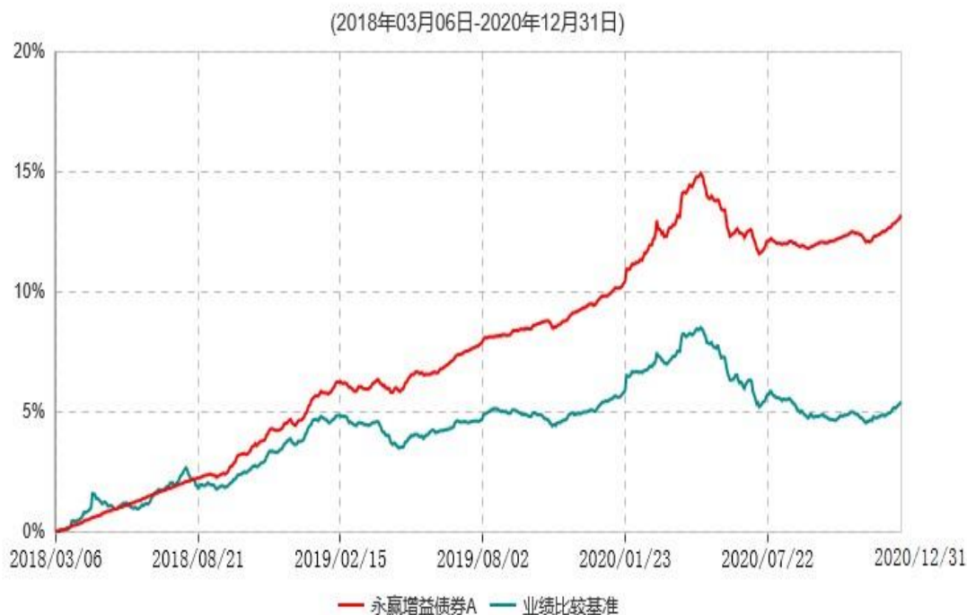
永赢增益债券A累计净值增长率与业绩比较基准收益率历史走势对比图

注：本基金建仓期为本基金合同生效日起 6 个月，建仓期结束当日，除债券投资比例未达到合同约定外，其他各项资产配置符合合同约定。债券投资比例未达到合同约定系交易对手原因导致现券买入交易结算失败所致，本基金于 2018 年 9 月 6 日及时买入债券将债券投资比例提高至合同约定的范围内。