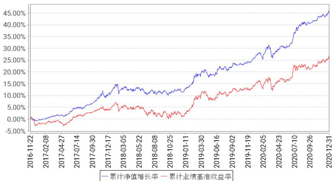
工银新得益混合累计净值增长率与同期业绩比较基准收益率的历史走势对比图