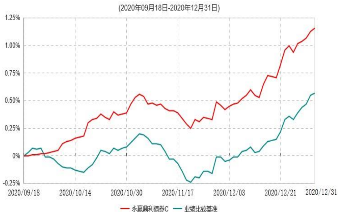
永赢鼎利债券C累计净值增长率与业绩比较基准收益率历史走势对比图

注：1、本基金合同生效日为 2020 年 09 月 18 日，截至本报告期末本基金合同生效未满 1 年； 2、本基金建仓期为本基金合同生效日起 6 个月，截至本报告期末，本基金尚处于建仓期中。