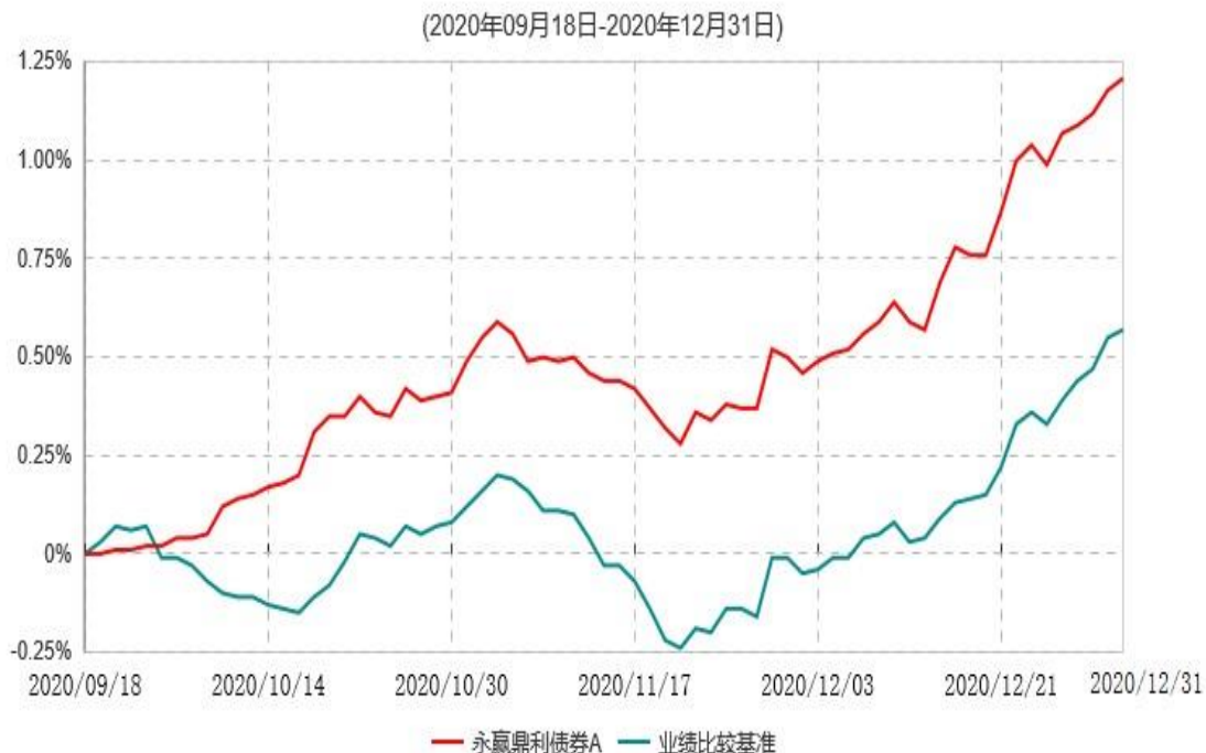
永赢鼎利债券A累计净值增长率与业绩比较基准收益率历史走势对比图

注：1、本基金合同生效日为 2020 年 09 月 18 日，截至本报告期末本基金合同生效未满 1 年； 2、本基金建仓期为本基金合同生效日起 6 个月，截至本报告期末，本基金尚处于建仓期中。