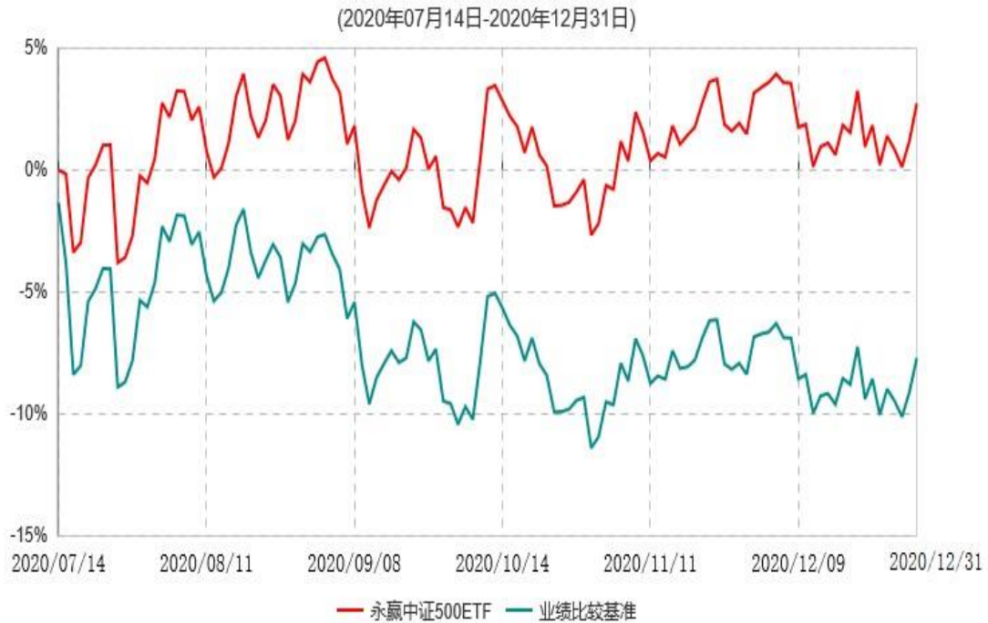
永赢中证500交易型开放式指数证券投资基金累计净值增长率与业绩比较基准收益率历史走势对比图

注：1、本基金合同生效日为2020年07月14日，截至本报告期末本基金合同生效未满1年； 2、本基金建仓期为本基金合同生效日起6个月，截至本报告期末，本基金尚处于建仓期中。