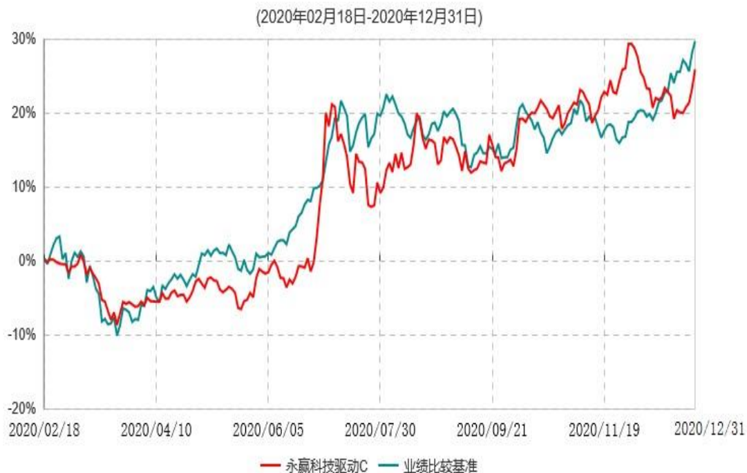
永赢科技驱动C累计净值增长率与业绩比较基准收益率历史走势对比图

注：1、本基金合同生效日为 2020 年 2 月 18 日，截至本报告期末本基金合同生效未满 1 年；