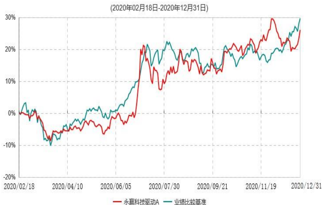
永赢科技驱动A累计净值增长率与业绩比较基准收益率历史走势对比图

注：1、本基金合同生效日为 2020 年 2 月 18 日，截至本报告期末本基金合同生效未满 1 年；