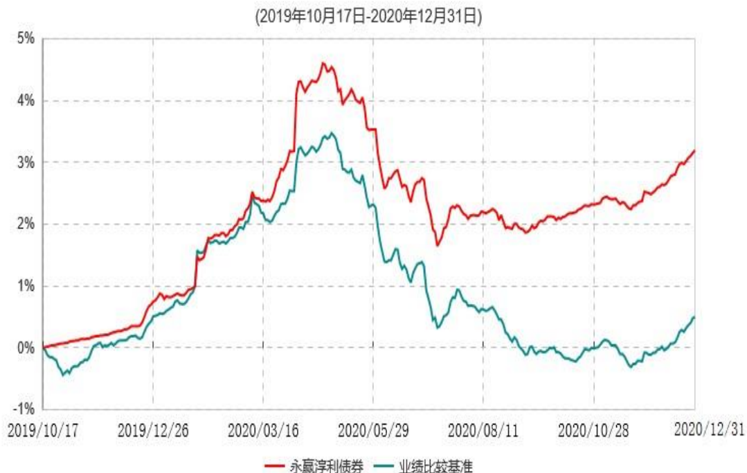
永赢淳利债券型证券投资基金累计净值增长率与业绩比较基准收益率历史走势对比图