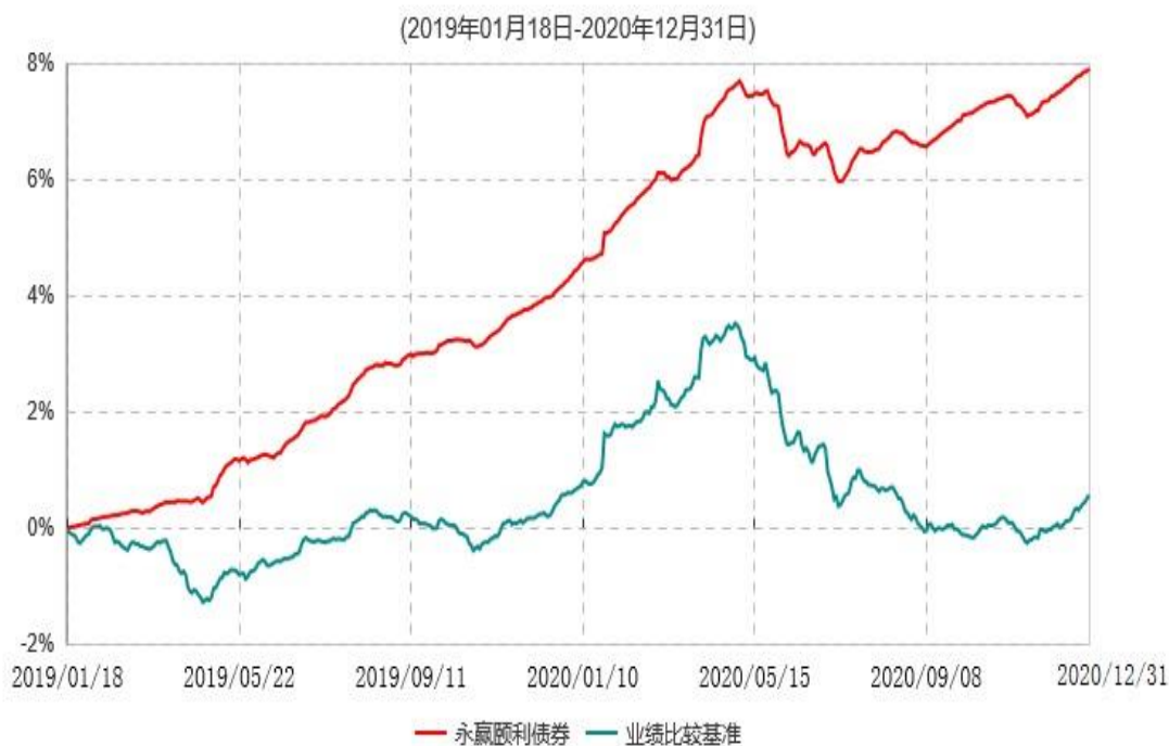
永赢颐利债券型证券投资基金累计净值增长率与业绩比较基准收益率历史走势对比图