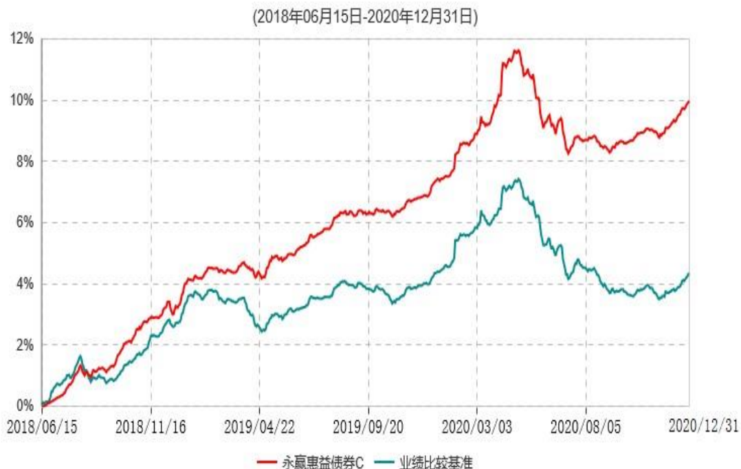
永赢惠益债券C累计净值增长率与业绩比较基准收益率历史走势对比图