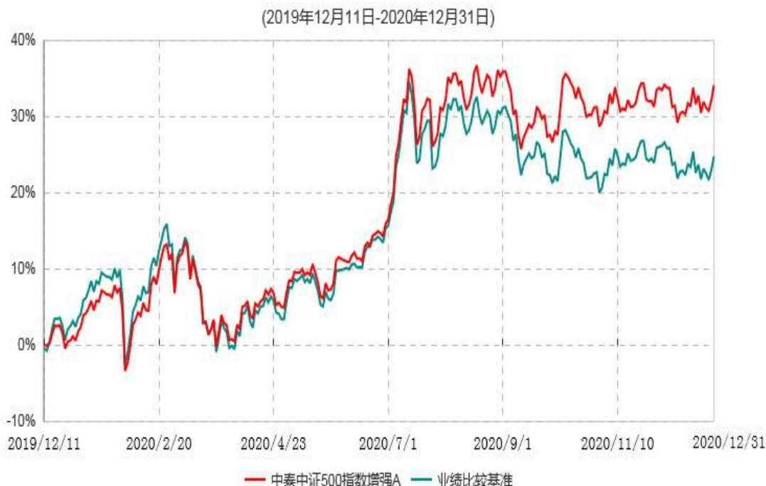
中泰中证500指数增强A累计净值增长率与业绩比较基准收益率历史走势对比图

注：根据基金合同约定，本基金自基金合同生效之日起 6 个月内为建仓期。建仓期结束时，本基金各项资产配置比例符合基金合同约定。