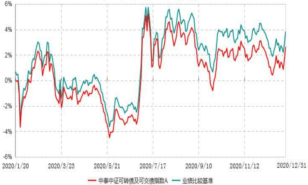
中泰中证可转债及可交换债券指数A累计净值增长率与业绩比较基准收益率历史走势对比图 (2020年01月19日-2020年12月31日)

注：（1）本基金基金合同生效日期为 2020 年 1 月 19 日，至本报告期末本基金成立未 满 1 年。