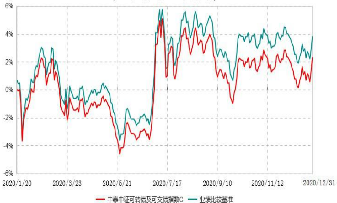
中泰中证可转债及可交换债券指数C累计净值增长率与业绩比较基准收益率历史走势对比图 (2020年01月19日-2020年12月31日)

（2）根据基金合同约定，本基金自基金合同生效之日起 6 个月内为建仓期。截至本报 告期末，本基金已建仓完毕，且建仓期结束时，本基金各项资产配置比例符合基金合同 约定。