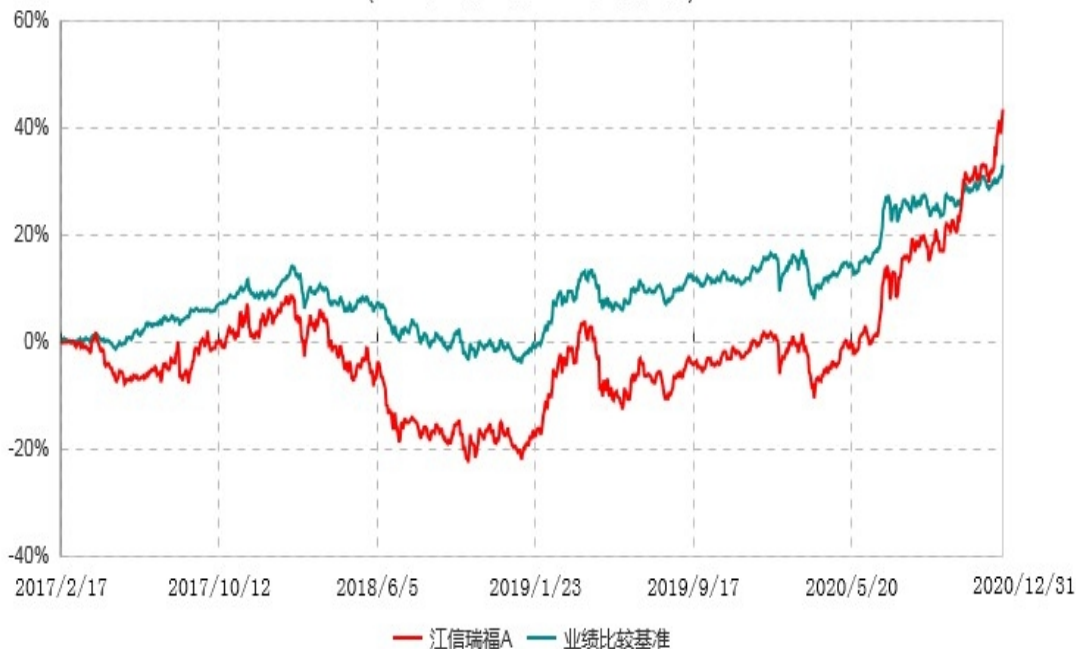
江信瑞福C累计净值增长率与业绩比较基准收益率历史走势对比图