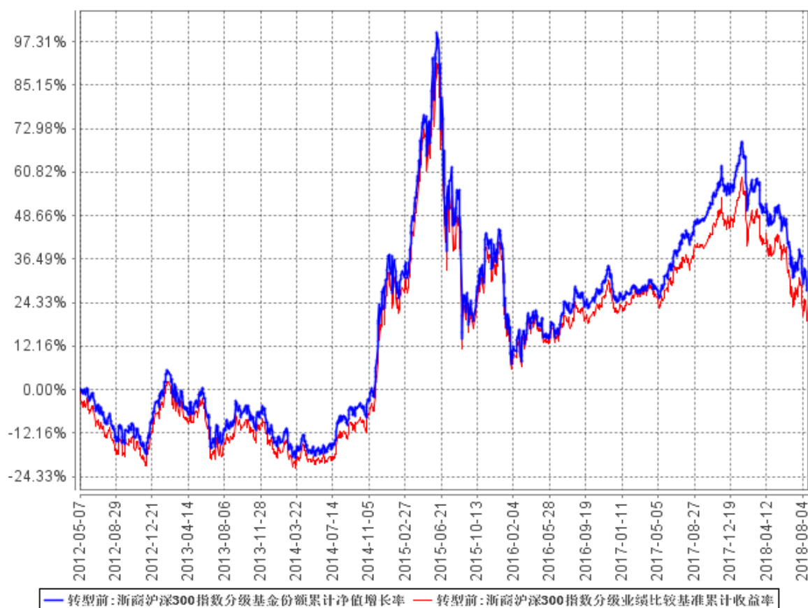
浙商沪深300指数分级基金份额累计净值增长率与同期业绩比较基准收益率的历史走势对比图