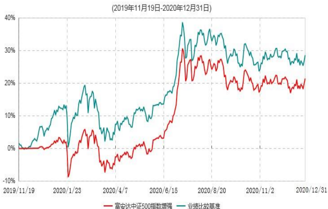
富安达中证500指数增强型证券投资基金累计净值增长率与业绩比较基准收益率历史走势对比图