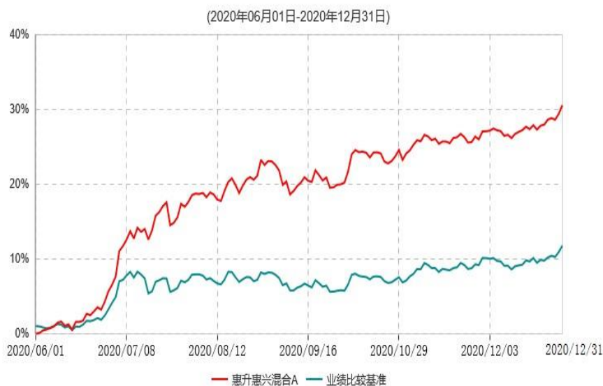
惠升惠兴混合A累计净值增长率与业绩比较基准收益率历史走势对比图