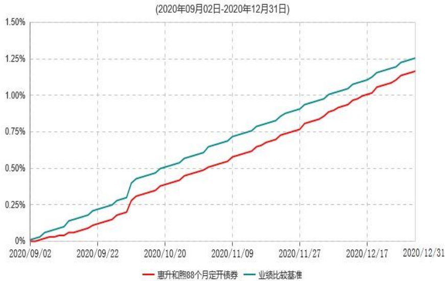
惠升和煦88个月定期开放债券型证券投资基金累计净值增长率与业绩比较基准收益率历史走势对比图