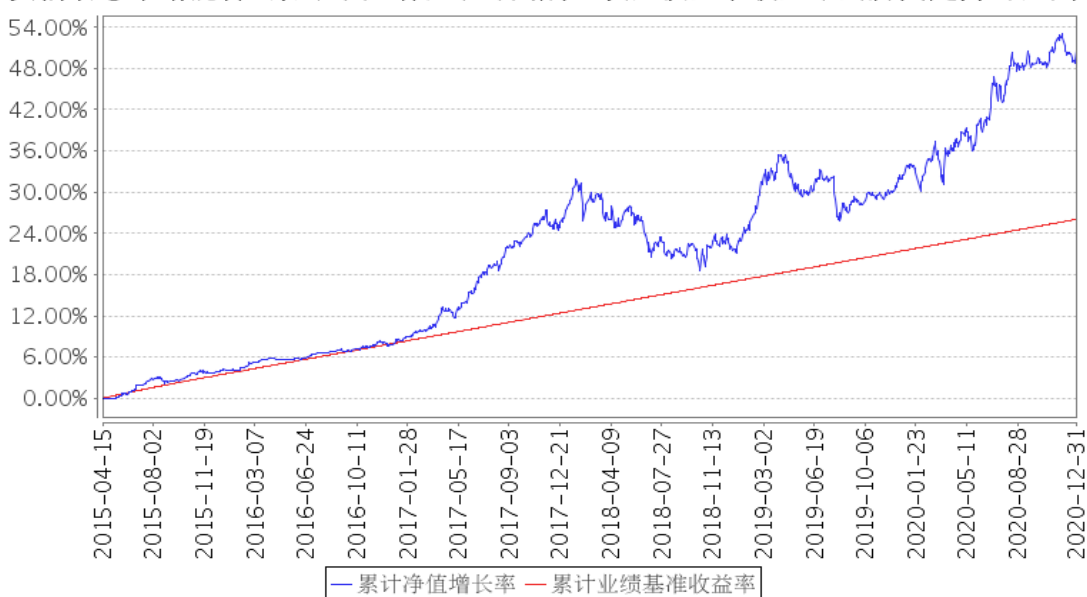
安信动态策略混合A累计净值增长率与同期业绩比较基准收益率的历史走势对比图