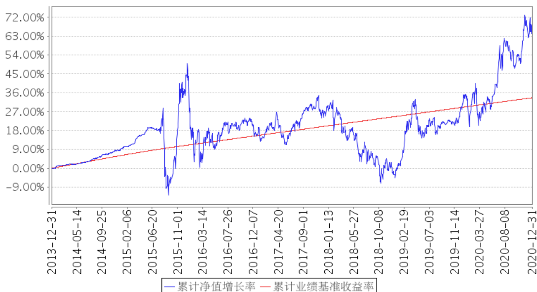
安信鑫发优选混合累计净值增长率与同期业绩比较基准收益率的历史走势对比图