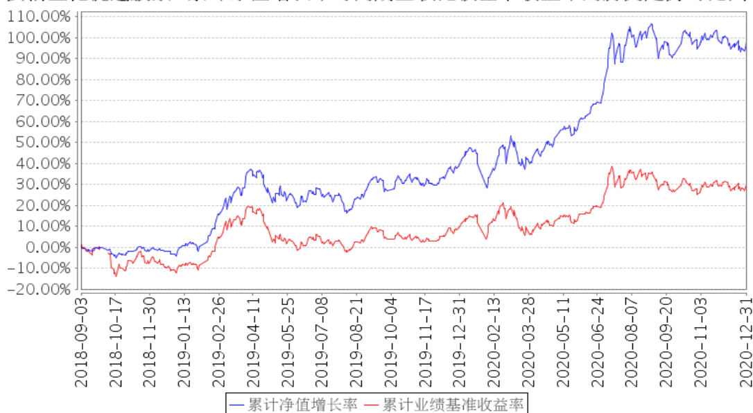
安信量化优选股票A累计净值增长率与同期业绩比较基准收益率的历史走势对比图