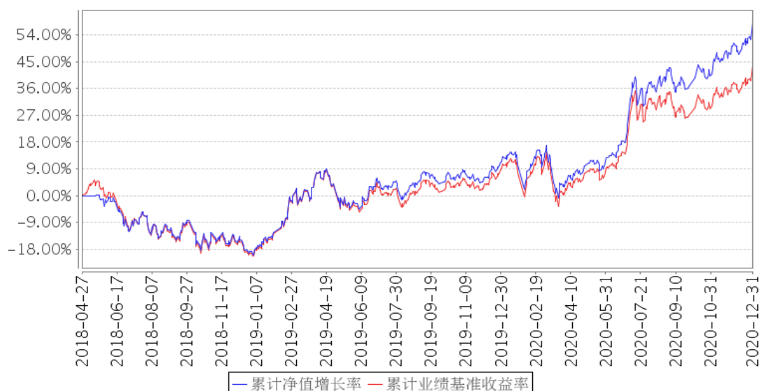
景顺长城MSCI中国A股国际通ETF累计净值增长率与同期业绩比较基准收益率的历史走势对比图