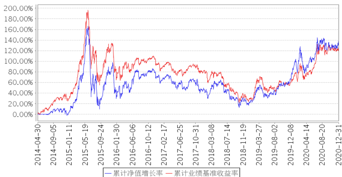
景顺长城中小板创业板精选股票累计净值增长率与同期业绩比较基准收益率的历史走势对比图

注：本基金的投资组合比例为：本基金将基金资产的 80%-95% 投资于股票资产，其中投资于中小板及创业板的上市公司股票不低于非现金基金资产的 80%，权证投资比例不超过基金资产净值的 3%，每个交易日日终在扣除股指期货合约需缴纳的交易保证金后，本基金保留的现金或到期日在一年以内的政府债券不低于基金资产净值的 5%。本基金的建仓期为自 2014 年 4 月 30 日基金合同生效日起 6 个月。建仓期结束时，本基金投资组合均达到上述投资组合比例的要求。