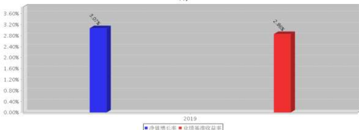
建信中债1-3年国开行债券指数A基金每年净值增长率与同期业绩比较基准收益率的对比图(2019年12月31日)