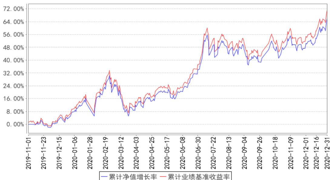
创新ETF累计净值增长率与同期业绩比较基准收益率的历史走势对比图

注：按基金合同的规定，本基金自基金合同生效起六个月为建仓期，建仓期结束时本基金的各项资产配置比例已达到基金合同的规定： 本基金主要投资于标的指数成份股及备选成份股。在建仓完成后，本基金投资于标的指数成份股及备选成份股的资产比例不低于基金资产净值的 90%，且不低于非现金基金资产的 80%，因法律法规的规定而受限制的情形除外。