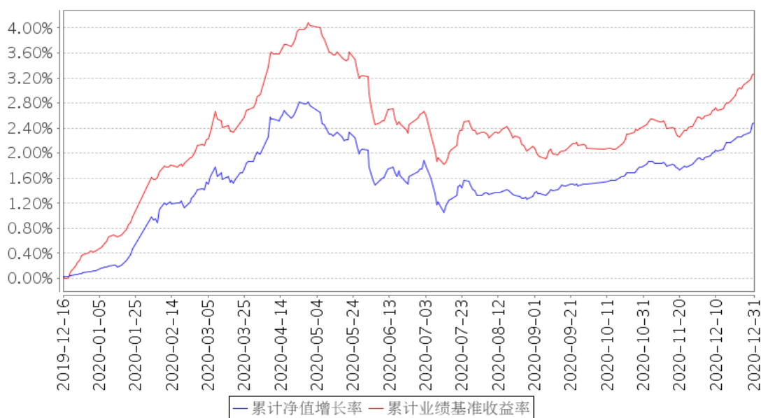
平安惠涌纯债累计净值增长率与同期业绩比较基准收益率的历史走势对比图