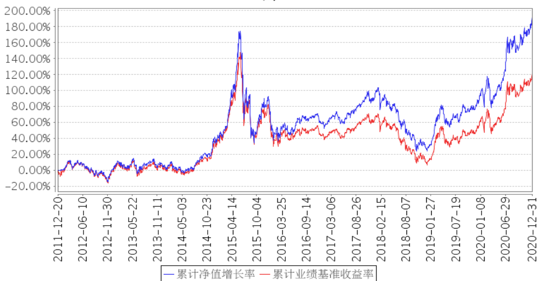
平安深证300指数增强累计净值增长率与同期业绩比较基准收益率的历史走势对比图