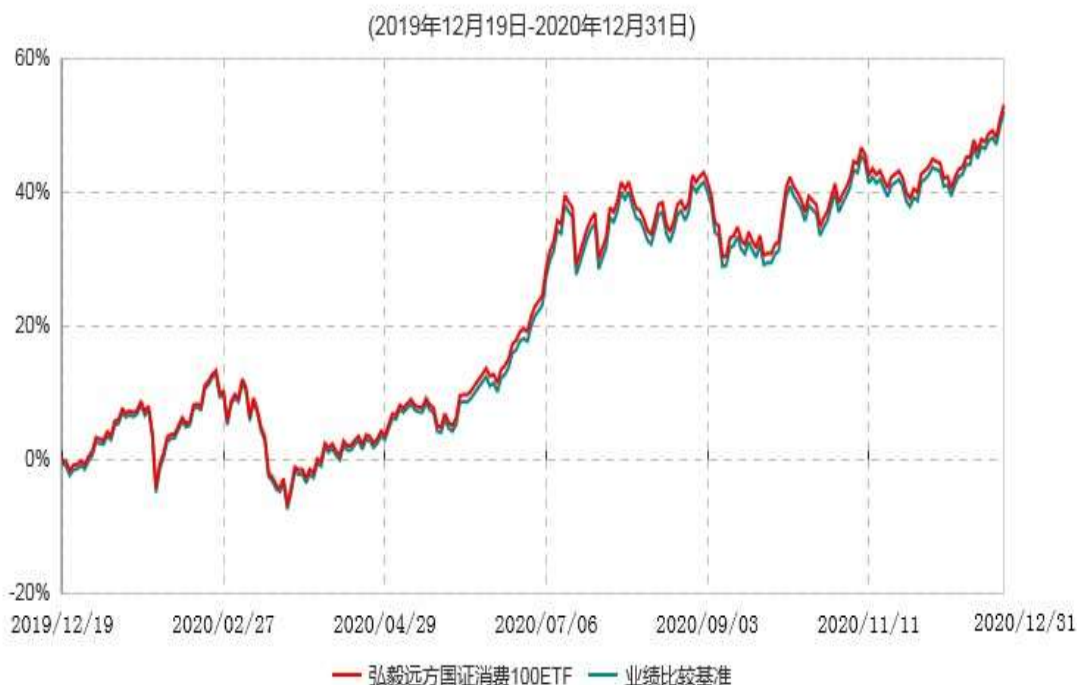
弘毅远方国证消费100交易型开放式指数证券投资基金累计净值增长率与业绩比较基准收益率历史走势对比图

注：本基金基金合同生效日为2019年12月19日。截至建仓期结束，本基金各项资产配置比例符合基金合同及招募说明书有关投资比例的约定。