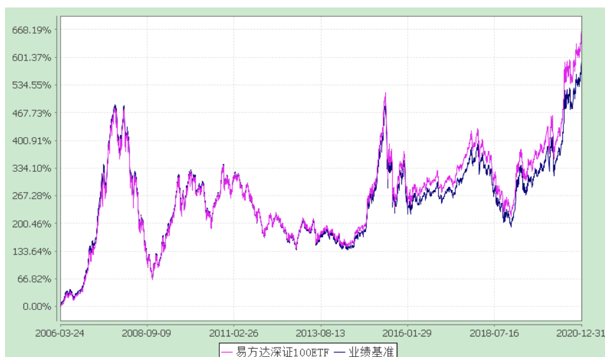
易方达深证 100 交易型开放式指数基金 份额累计净值增长率与业绩比较基准收益率历史走势对比图 (2006 年 3 月 24 日至 2020 年 12 月 31 日)

注：自基金合同生效至报告期末，基金份额净值增长率为 667.82%，同期业绩比较基准收益率为 591.38%。