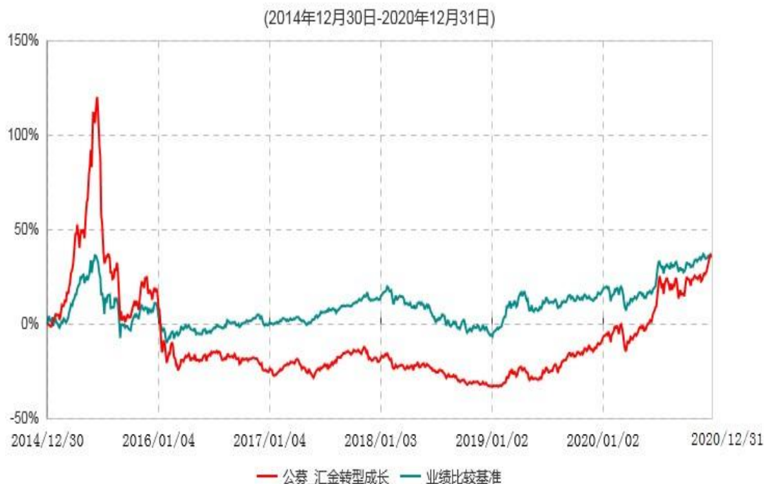
浙商汇金转型成长混合型证券投资基金累计净值增长率与业绩比较基准收益率历史走势对比图